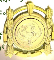
令和5年度 東京都スポーツ功労賞 スポーツ功労団体