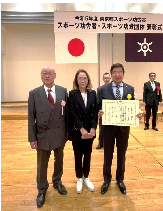
令和5年度 東京都スポーツ功労賞 スポーツ功労者・スポーツ功労団体 表彰式