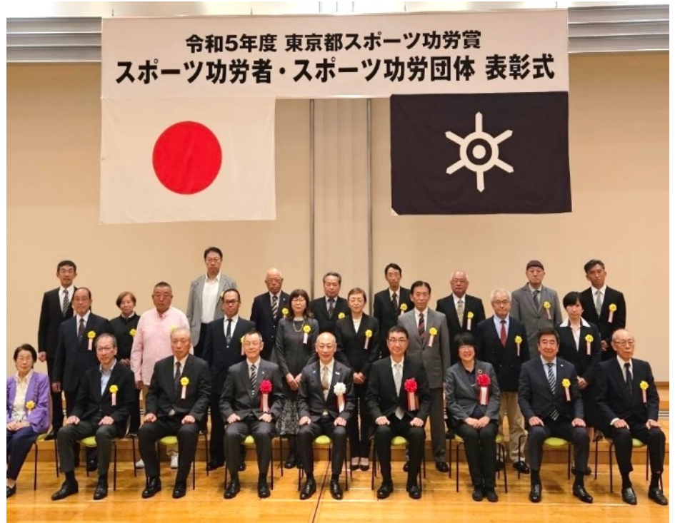
令和5年度 東京都スポーツ功労賞 スポーツ功労者・スポーツ功労団体 表彰式